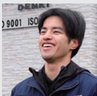
電気工事士 H.O (2022年入社)

一人で分電盤を取り付けられた時、「職人になれたかも」と思いました。失敗しても先輩は怒らず指導してくれました。自ら率先して手を挙げ新しい仕事に挑戦すれば、早く上達できます。辛いこともありますが、達成感がこの仕事のやりがいです。