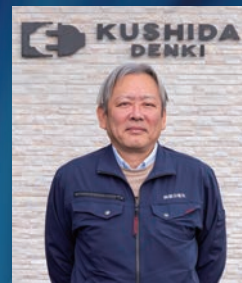
櫛田電気 代表取締役

私たちの仕事は、建物に電気を通し、暮らしや産業の「当たり前」を支える仕事です。配線一つ、器具一つにも正確さと責任が求められますが、その分やりがいや達成感も非常に大きい仕事です。ありがたいことに地域の皆さまからの信頼も厚く、仕事の依頼は年々増え続けています。そんな中で、私たちは新しい仲間を探しています。経験の有無は問いません。最初は分からなくて当然です。大切なのは、真面目にコツコツ取り組む姿勢と、仲間との協力を大切にできること。この会社には、先輩がしっかり教え、技術を身につけていける環境があります。「手に職をつけたい」「社会に役立つ仕事をしたい」そんな想いを持っている方、ぜひ一度お話ししましょう。あなたの挑戦を、私たちは全力で応援します。